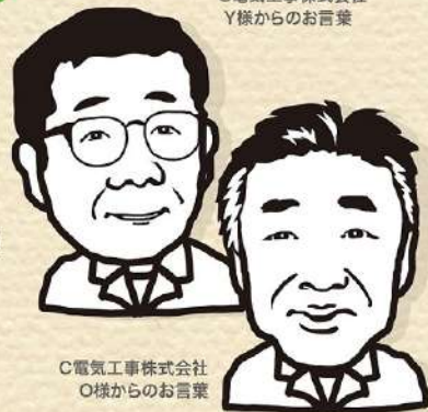
C電気工事株式会社 Y様からのお言葉