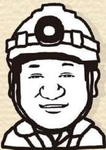
株式会社S Y様からのお言葉