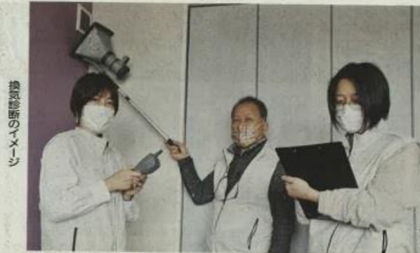
換気設備のイメージ

の経済支援策として、国や自治体や中堅・中小企業の設備投資への助成金を設けており、導入にあたり助成金が活用できる点もアピールする。 河津社長は「まずは展示会で認知度を高めていく。同加工機を使った加工も請け負う」と話している。