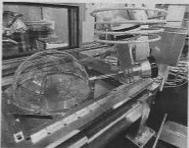
アクリル地球儀の加工の様子