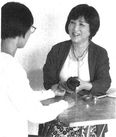
課題を見つけ必要なサービスを提案する